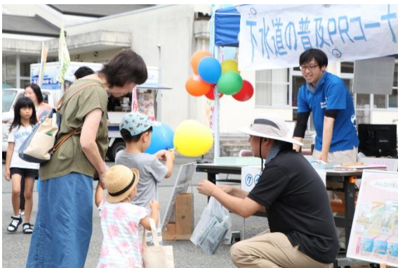
▲市民と団体の交流の様子