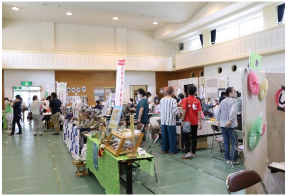
▲多目的ホール内の様子