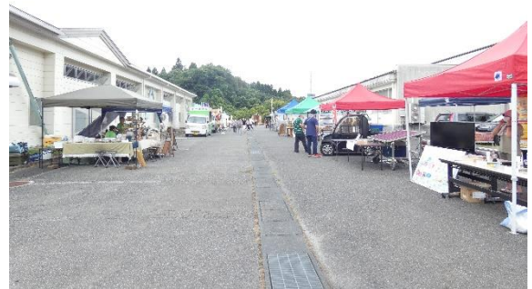
▲屋外ブース（3m×3mのテント約20基設置可能）