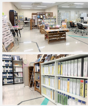
▲いちのせき事務所(なのはなプラザ4階)の様子。地域協働体ファイルでは協議会便りや総会資料等をご覧いただけます。

個別相談にも対応しています。 団体の設立・変更・解散等 に関しては書類作成のサポートも可能です。 助成金等 に関しては、毎月 助成金情報をまとめたペーパー を作成しておりますので、ご活用ください。具体的な申請に関するサポートも可能です。 また、「 情報コーナー 」として、市内の NPO法人に関する情報 や、市民活動の動きをスクラップしたものの、 各地域協働体の情報 をまとめたファイルなども配架しており、自由に閲覧することができます(閲覧スペースあり)。 ※市内のNPO法人に関する情報は当センターホームページにも掲載しています。