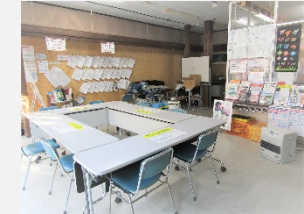
◀せんまや事務所(せんまやサテライト)では、会議や集会等の貸室利用も承っています。

開設日：月～土曜(日祝休館) 開設時間：9時～18時 対象：どなたでも可 料金：無料